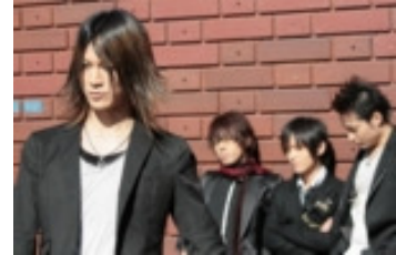
le groupe Acid FLavoR

Réservations (pour le concert) sur la page MySpace de Râmen Events ( www.myspace.com/ramen-events ) ou sur le site (contacts mail et téléphone sur www.ramen-events.com ).